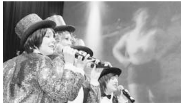
Musik und Bilder gibt es bei der Wupper-Gala.