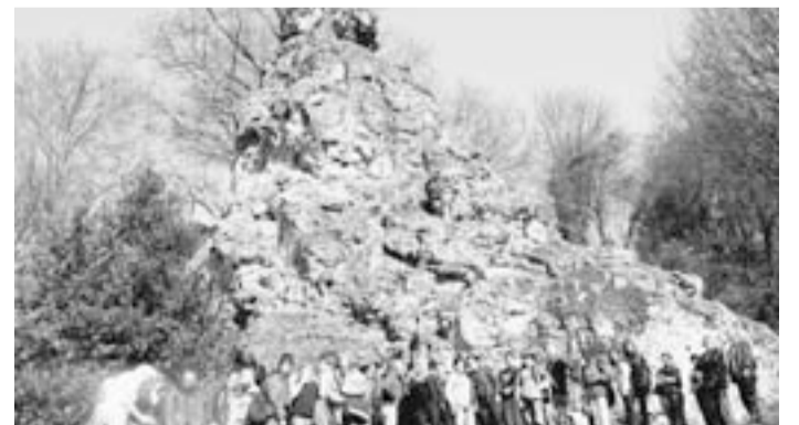
Gruppenbild mit Felsen: Blick auf den Hohenstein.

Nicht in eleganten Seiden-Gewändern, sondern locker in Jeans drängten sich indes gestern Mittag junge Leute um den Dolomit-Fels: Schüler der Realschule Hohenstein . Die Paten des Parks haben in einer AG Müll weggeräumt und Blumen-Zwiebeln gepflanzt. Mit Unterstützung der